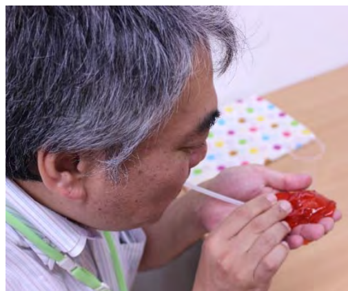
大洋製薬さんの科学実験。本業を生かした社会貢献活動です。文京ボランティア市民活動まつりにも出展予定です。