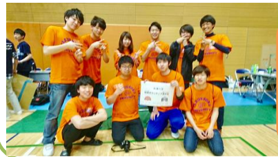
拓殖大学 地域ボランティア 愛好会

今回11名で参加させていただきました。お揃いの拓大Tシャツを着て、会場の警備やブースの運営、補助などを行いました。地域の大人の方や子どもたち、他大学の学生と触れ合うことができました！中でも、拓殖大学のOBの消防士の先輩とお会いすることができ、とても良かったです！今後も地域に根ざした活動をしていきたいです！