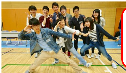
中央大学 いこボラ！

小学生の頃お世話になってた大学生たちがこんなに大変な仕事をしていたのだと思うと頭が上がりません。まだ至らない部分の多い私ですが、これから経験を積みあの大学生たちのように小学生を楽しませられるような人材になりたいです。