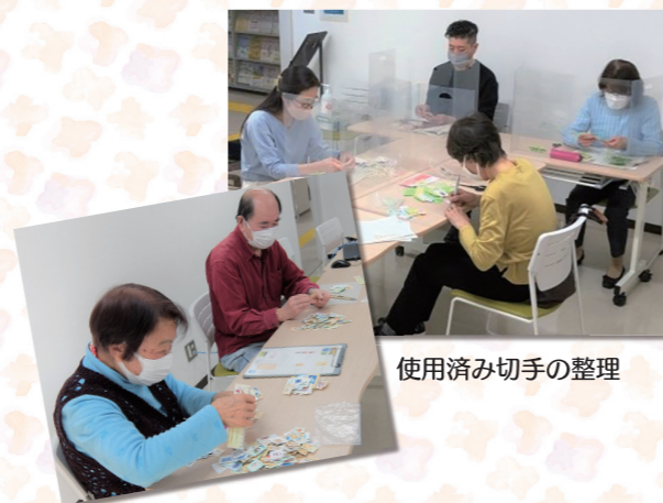
使用済み切手の整理

文京ボランティア支援センター TEL 03-3812-3114 Eメール vorasen@bunsyakyo.or.jp