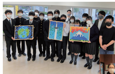
当日参加された皆さん

キャップアートとは、ペットボトルのキャップを再利用して絵や文字を描き、アート作品にすることです。去る11月20日(土) 文京区民センター会議室で、ペットボトルキャップアートのイベントを実施しました。幼稚園児さんから小学生、高校生、大学生、社会人とさまざまな方々のアイデアが盛り込まれた3作品が完成し、高齢者福祉施設に寄贈されました！