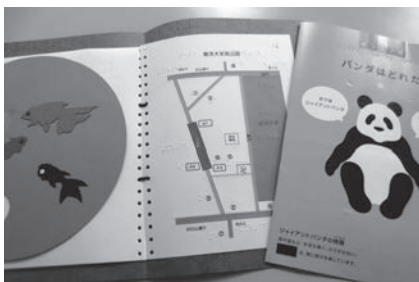
夏の親子ポラでの作品など