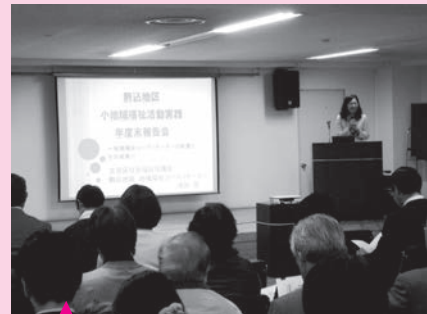
皆さん熱心に聞いてくれました！

昨年の4月に地域福祉コーディネーターとして、駒込地区に配置されてから1年が経ちました。1年の総まとめとして、3月28日に「駒込地区小地域福祉活動実践 年度末報告会～地域福祉コーディネーターの配置とその成果～」を開催しました。