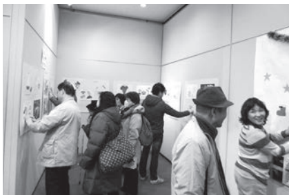
2/26ワークショップより みんなで絵を触っています。