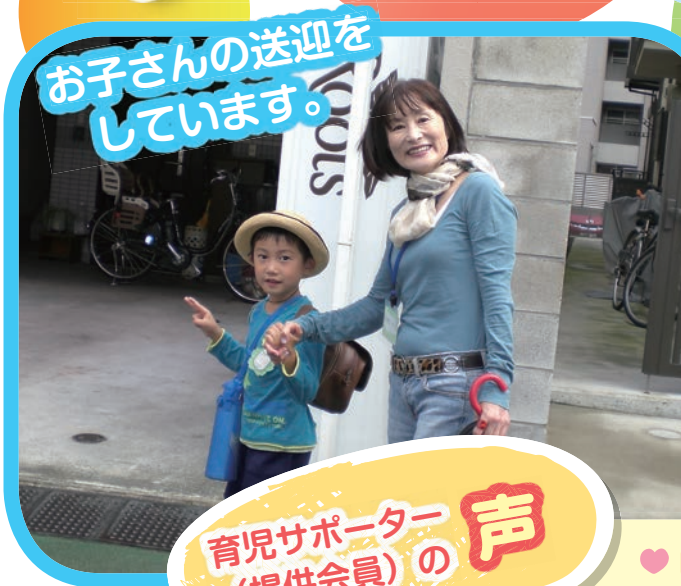
お子さんの送迎をしています。