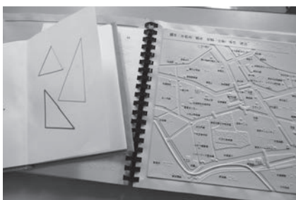
触図（おでかけマップ等）