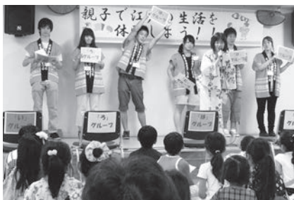
夏休み親子ボランティア体験教室 「親子で江戸の生活をしよう!!」