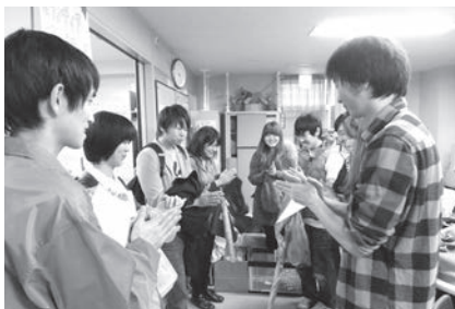
文京ボランティア・市民活動まつり

ボランティアの依頼はこちらまで 東洋大学 学生ボランティアセンター http://toyo-gakubola.jimbo.com/ ☎ 3945-8219 E-mail volunteer.toyo.u@gmail.com ※ボランティア加入希望は東洋大学生のみ受け付けています