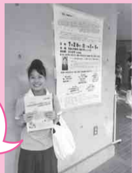
地域で活躍する 先輩方に続ける ように頑張ります!