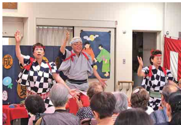
『かつぼれおさらい会』かつぼれ

既存の団体の活動に参加する・仲間と新しくボラ ンティア団体を立ち上げるなど、みなさんにあった 形でボランティア活動をしてみませんか?お気軽 にボランティアセンター にお問合せください。