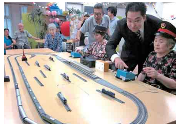
『ボランティアリーダー会』鉄道模型運転体験

問 地域福祉推進係 (文京ボランティア・市民活動センター) ☎ 3812-3114