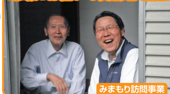
みまもり訪問事業