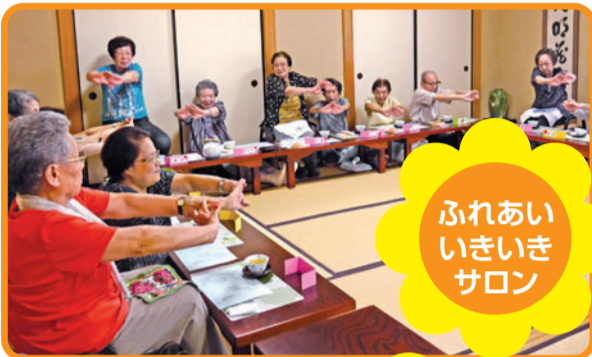
ふれあい いきいき サロン

☎03-3812-3040 ☎03-5800-2966 http://www.bunsyakyo.or.jp/