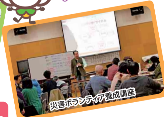
災害ボランティア養成講座