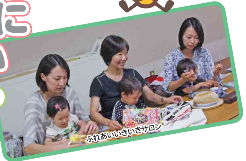
ふれあいいききサロン