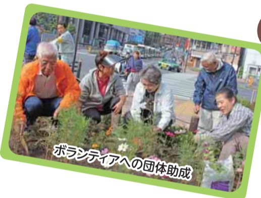
ボランティアへの団体助成