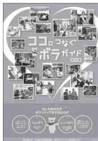
ココロつなぐボラガイド

原稿用紙(回答票)は、申込先で配布。 ホームページ http://www.bunsyakyo.or.jp/ からもダウンロード可。 前回掲載団体へは、別途ご案内を送付させていただきますので、ご覧ください。