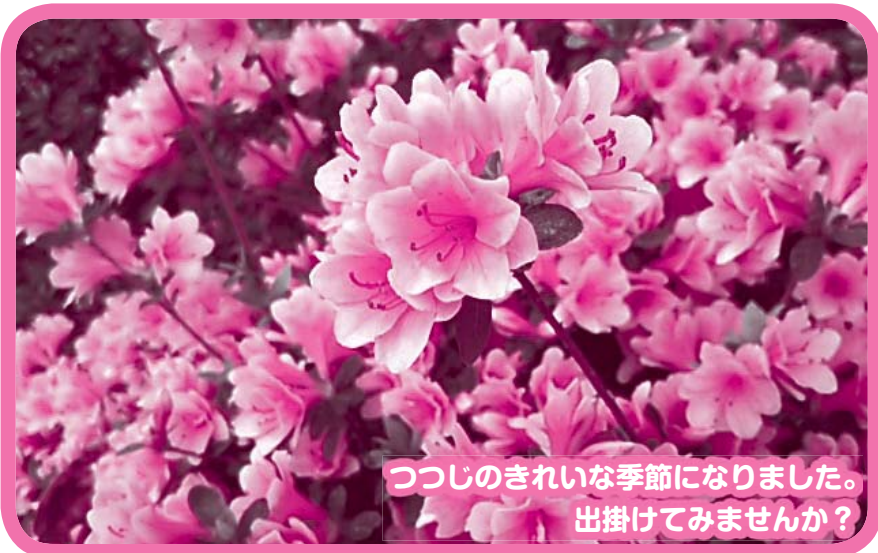
つつじのきれいな季節になりました。出掛けてみませんか？