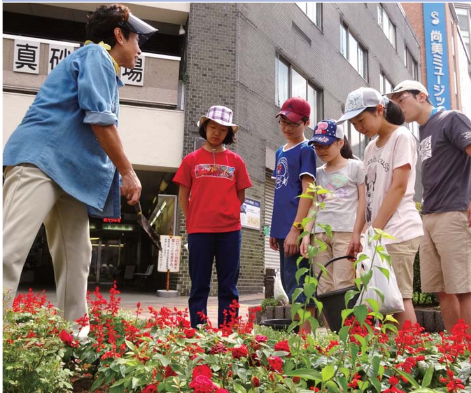
花壇づくりボランティア体験中