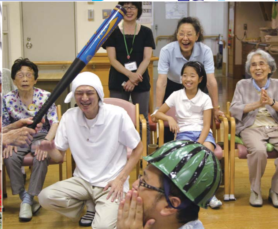
高齢者施設でレクリエーション参加中