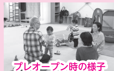
プレオープン時の様子

地域で子どもが安心して遊んだり、学んだり、過ごしたりできる居場所“さきちゃんち”が小石川(富坂地区)に9月2日オープンしました。有志の人たちで運営委員会を設置し、地域の様々な方のご協力を得ながら活動しています。9月16日にはオープニングイベントも予定しています！詳細は次号11月10日号にて報告します！