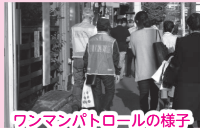
ワンマンパトロールの様子

今回のコーディネーター通信では、大塚地区の防犯の見守り活動「ワンマンパトロール」についてご紹介します。ワンマンパトロールは、大塚公園でラジオ体操に参加されている有志の方々が集まって始めた月1回の防犯パトロールで、大塚警察署と協力しながら、小学生の下校の時間に合わせてパトロールコースを皆で歩きます。パトロールの人数やメンバーは固定せず、参加できる人が無理のない範囲で参加する形をとり、10年以上活動が継続しています。