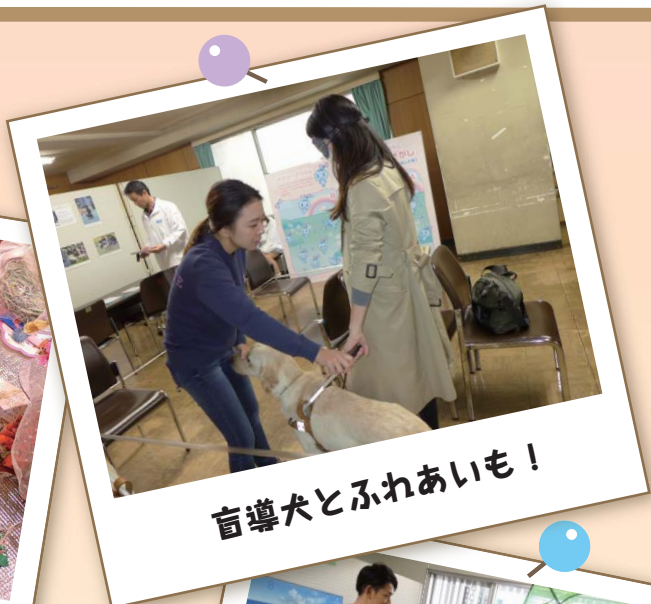
盲導犬とふれあいも！