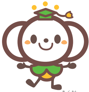
文社協キャラクター「きく文」