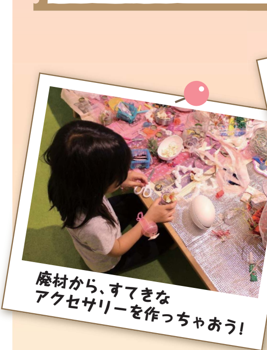
廃材から、素敵なアクセサリーを作っちゃおう！