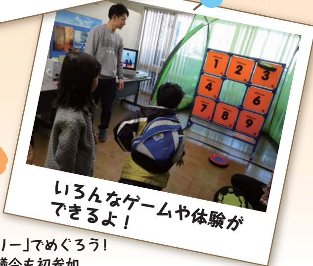
いろんなゲームや体験ができるよ！