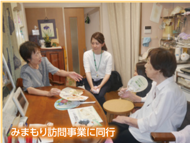
みまもり訪問事業に同行

行政やサービスのパイプ役として、様々な関係機関と連携をしながら、地域に寄り添い「いてくれると安心」と言ってもらえるように心がけて活動しています。