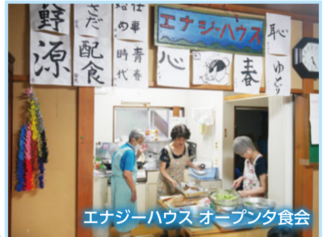
エナジーハウス オープン夕食会

普段の活動がみえにくい施設ですが、自然に地域にとけこめるようにと願っています。夕食会の調理の手伝いは私の楽しみでもあります。