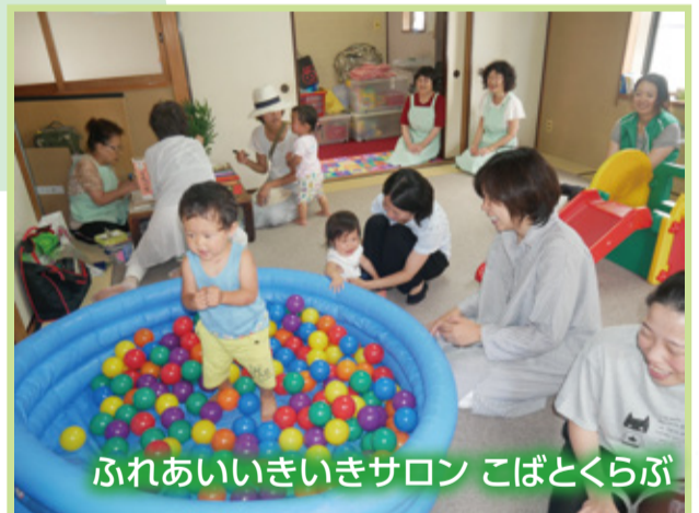
ふれあいいきいきサロン こぼとくらぶ

ママたち同士が交流しやすい雰囲気作りを心がけています。親と子と地域をつなげる場として子育て世代を応援しています。