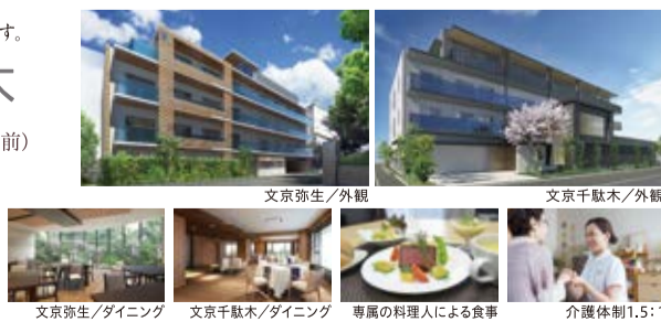
文京弥生/ダイニング 文京千駄木/ダイニング 専属の料理人による食事 介護体制1.5:1