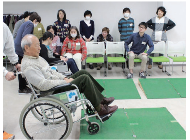
文京ささえ隊が行う車椅子体験の様子