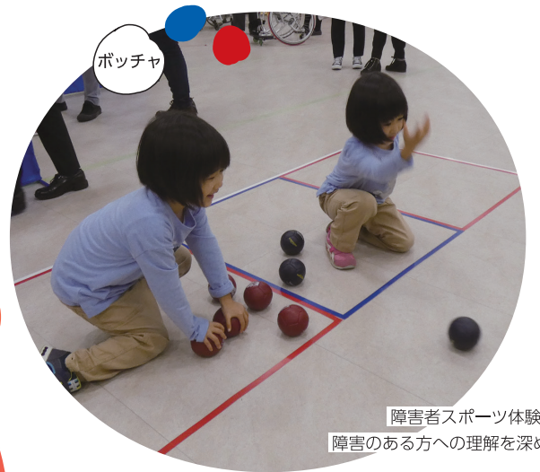
障害者スポーツ体験など、障害のある方への理解を深めます