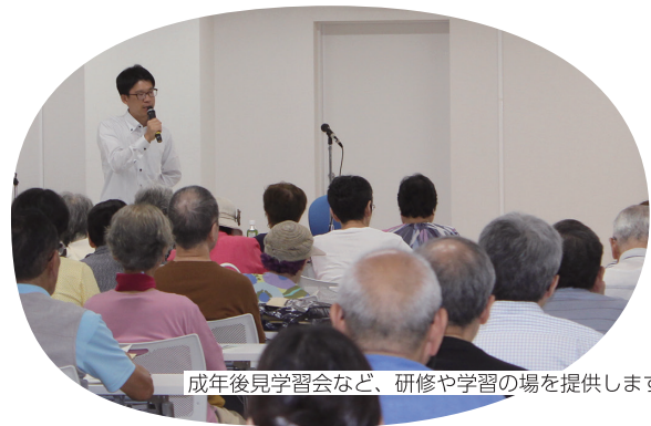
成年後見学習会など、研修や学習の場を提供します