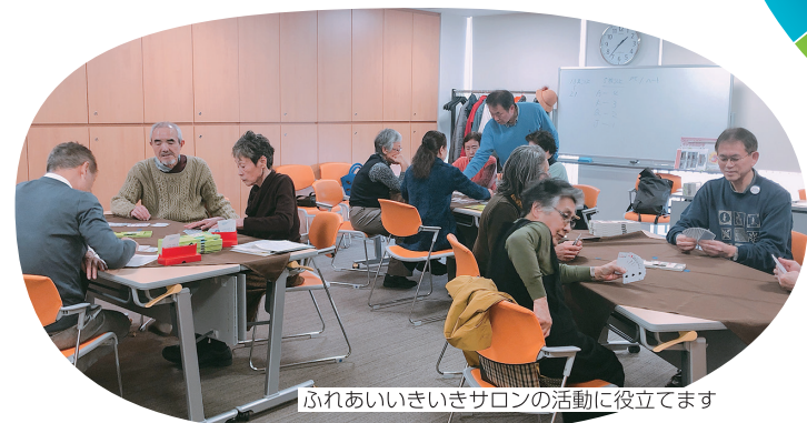
ふれあいいきいきサロンの活動に役立てます