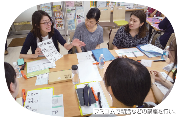
フミコムで朝活などの講座を行い、NPO活動を支援します