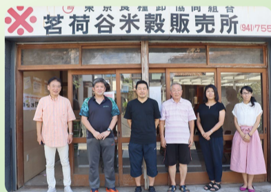
ゲスト こびなたぼっこ※

子どもたちの「話すちから」を高めるため、オンライン教育推進活動、学校向けアクティブラーニングの出前授業、教員研修、ワークショップを行っています。