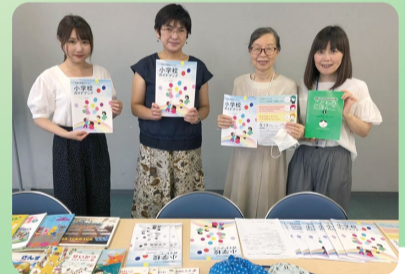
ゲスト 文京多言語 サポート ネットワーク

2020年9月から活動を開始したばかりの、お米屋さんだった店舗を活用した地域の居場所です。赤ちゃんからお年寄りまで気軽に集える場所を目指しています。