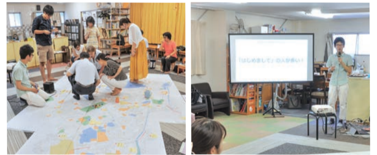
これまでの「さきちゃんち」での活動の様子

それぞれ、子育てや子どもに関わる活動をしていきたいと考えていたメンバーが、文京区主催のソーシャルインベーション・プラットフォームのイベントで知り合い、「子どもたちがまちの人に見守られながら過ごせる場所をつくりたい」という思いを実現するために活動を始めました。地域には「孤育て」に悩む親御さんや、さまざまな事情で家や学校に居場所がない子どもたちがいます。私たちは「まちのリビング・ダイニング・キッチン(LDK)」と呼んでいます。子どもたちを中心に、その保護者や地域の方々が集まり、みんなで共有し、つながりあえる場所をつくることで、誰もが安心して暮らせる地域づくりに貢献できるのではないかと考えています。