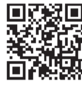
▲アーカイブ動画 (2020見本市特設サイト)

今年、文京区内で活動されている方々の紹介とあわせて、改めてフミコムについても紹介します。詳細は決まり次第、フミコムホームページなどお知らせしますので、ぜひチェックしてみてくださいね。