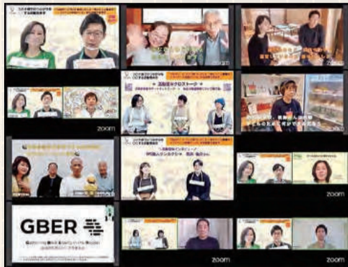
昨年度ご登壇いただいたみなさま

昨年度は「コロナ禍でのつながりを〇〇する」というテーマで開催した活動見本市。新型コロナウイルスの影響を受けこれまでどおりの「つながりかた」が難しくなったなか、つながりを保ち続けるために模索し工夫しながら活動をつづけた約13団体の取り組みをご紹介します。