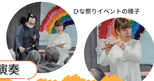
ひな祭りイベントの様子