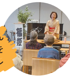
演目「時そば」の場面

私は落語歴10年になります。落語をやって、お客さんに笑ってもらったときは、とても嬉しいです。落語を聞いて笑うことで、みなさんに少しでも日々のストレスを忘れていただければと思っています。