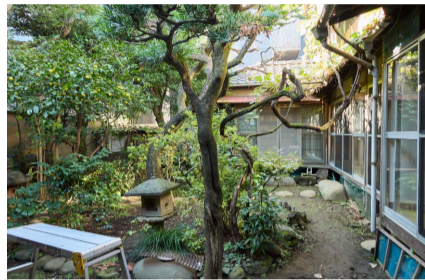
中庭で柚子を採る企画も