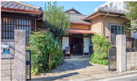
改築を重ね、時代を感じさせる玄関

地域の皆さんにとっては昔を懐かしんだり原風景に触れられたりできる場所として、建物に興味のある人たちにとっては生きた資料として、ゆくゆくは訪れる皆さんの憩いの場にできればと思っています。