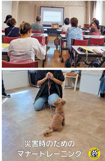
災害時のためのマナートレーニング