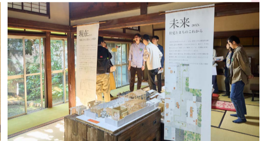
Bチャレ助成で制作された展示物(垂れ幕)