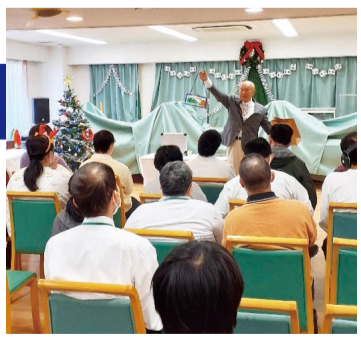
ボランティアでマジックする様子

【活動例】 「夫婦で楽器を趣味にしている。もともと学生時代から吹奏楽をやっていて、もう20年くらい弦楽器の練習をしているのだけれど、人に聞いてもらう機会がない。この趣味を活かせるボランティア活動はないだろうか。」という問合せをしたところ、地域連携ステーションから施設での演奏ボランティア活動を紹介された。施設の高齢者のリクエストに応えながら、生の演奏がとても喜ばれた。その後、継続的に複数の施設で活動している。