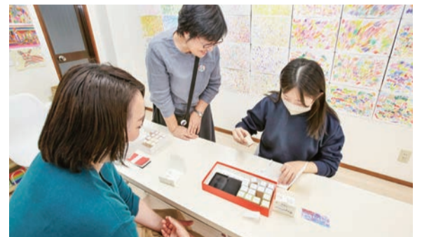
アート・コミュニケータとワークショップの様子