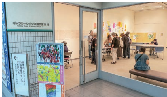
シビックセンターで展示の様子(令和5年8月)

障害者によるアート作品の展示会を開催。アート・コミュニケータ(詳細は3面)と連携することで、作品に関する理解を深められるようにし、誰もが多様性のある文化芸術活動に触れられる機会の創出を目指しています。2年目にあたる今年度は、昨年度と同様のシビックセンターでの展示とともに、作品が街に飛び出し、複数箇所に点在する形で作品を展示し、より身近な場所でアート展示を鑑賞できることを目指しました。