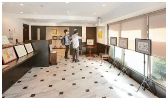
コミュニティカフェTweediaで展示の様子(令和5年11月)