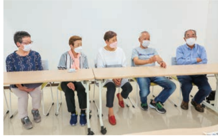
▲スタッフの皆さん

「どなたでも参加できる、まちの居場所づくりプロジェクト」として平成27年から開催されてきた「談話室千駄木」。コロナ禍では活動を休止する期間もありましたが、令和4年9月から再開することになりました。ここでの交流や催し物を心待ちにしていた方も多いのではないでしょうか。再開を前に、運営メンバーの皆さんに活動内容や、やりがいをお聞きました。