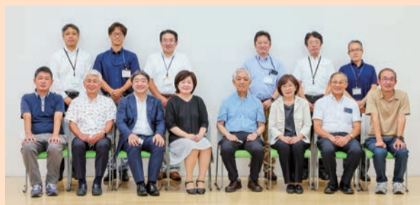
▲協議会 委員・幹事のみなさん

成年後見制度利用促進法を受け、制度を利用するご本人にメリットのある制度活用ができるよう、成年後見中核機関を文京区が設置し、文京区社会福祉協議会（社協）が事業の運営を受託しています。中核機関では、ご本人、ご本人を支える後見人等や支援関係者へのサポートを通じて、認知症や障害があっても、自分らしく安心して暮らせるように、地域で支える仕組みづくりに取り組んでいます。仕組みの1つとして、福祉・法律・医療等の専門職、学識経験者、相談機関、地域関係団体、行政、社協を構成員とした「権利擁護支援連携協議会」（協議会）を開催しています。