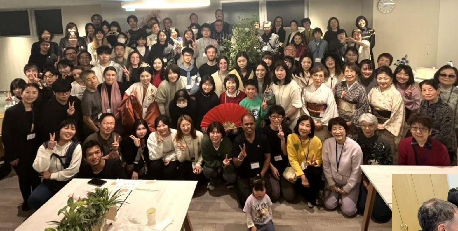
和菓子作り体験（1月）→