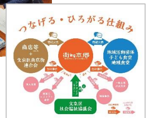
【認定NPO法人街ing本郷】（2023年度の事例） フードシェアリングサービス文京