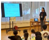
高齢者についての講話