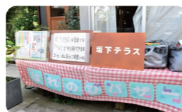
はれのひバザーの様子

シニアの方からお子様連れまで幅広い方が坂下テラスにきてくださいます。中には坂下テラスのバザーをきっかけに坂下テラスの常連さんになってくれて、店番スタッフになってくれた方もいます。「地域で仲間が増えると暮らしがより楽しくなる！」そう実感しながら私たちは坂下テラスで活動を続けていますので、坂下テラスが皆さまにとって、安心して楽しく過ごせる場になり、自然と仲間が増えていくような地域の縁側のような場所になったらうれしいです。