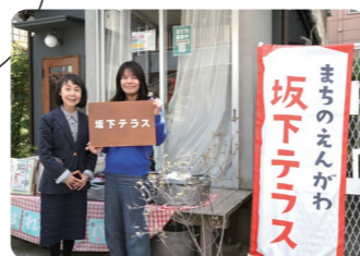
スタッフのソーさんと