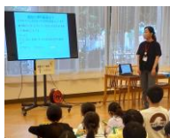
高齢者についての講話