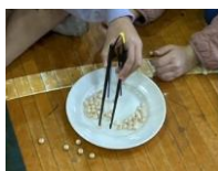
ユニバーサルデザイン体験