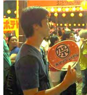
オマツリジャパン 共同代表