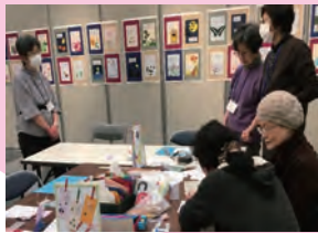
点訳・触図を広めるためのワークショップを開催！

点訳・触図の作成等で活躍！点字印刷や、分かりやすい表示方法を工夫するなど、細やかな対応が強みの団体さんです！