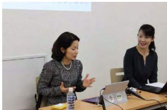
お二人の熱のこもったプレゼンテーション。

今回は土曜日の午後という時間。テーマは「子どもたちの発信力」ということで、日頃フミコムに足を運ばない小中学生を子育てしているお父さん、お母さんが参加されました。町会の掲示板をみて気になった方もいらっしゃいました。