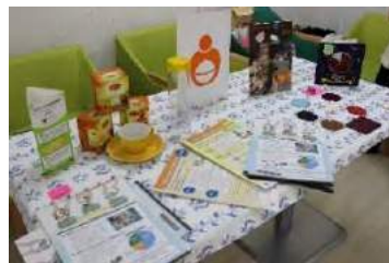
カラフルでわかりやすい展示。

6, 7 ページの記事に関する お問合せは「フミコム」まで 電話: 3812-3044