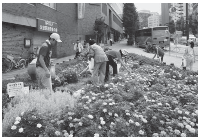
25年度助成団体 NPO法人緑のごみ銀行 生ごみ堆肥の腐葉土を利用した花壇づくりを通して、元気な緑と花と笑顔のあふれるまちを作ります

☎ 3812-3114 E-mail vorasen@bunsyakyo.or.jp