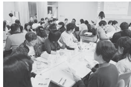
災害ボランティアセンターの設置方法を図上で検討中(昨年度の講座の様子)

内 大規模災害発生時に社会福祉協議会が設置する「災害ボランティアセンター」のスタッフとして活動するため、センターの役割や活動の実践方法について講義や実技を通じて学びます。