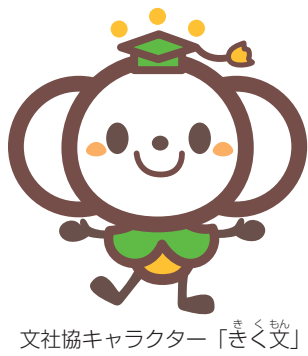
文社協キャラクター「まぐろ」