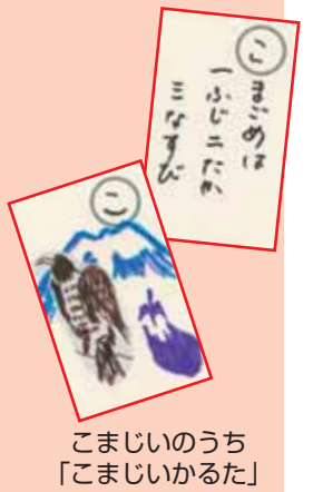
こまじいのうち 「こまじいかるた」