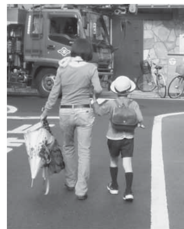
サポート中の様子。手をつないで安全にサポートしています。

ファミリー・サポート・センターは、地域の中で、育児の援助を受けたい方(依頼会員)と子育ての援助をして下さる方(提供会員)とが会員になり、育児について助け合う相互援助活動です。