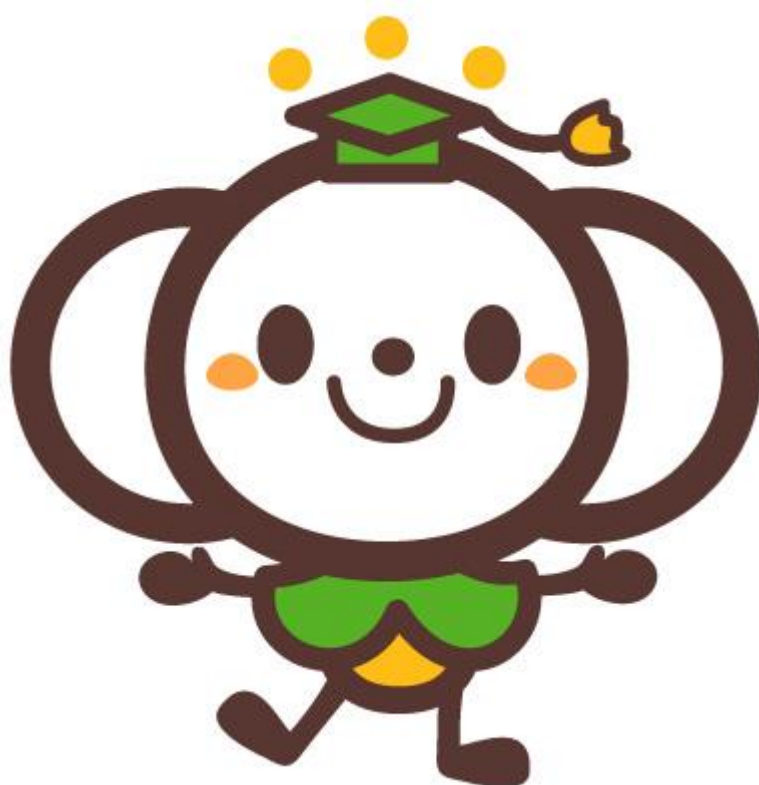
文社協キャラクター きく文（きくもん）

文京花の五大まつりの1つである文京梅まつりから「白い梅」をモチーフに、その梅が大きな耳のような役目で区民の皆さまのご意見をたくさんお伺いする様子をイメージしました。襟は、区の木であるイチヨウの葉を使いました。